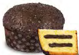
Panettone farcito al cioccolato