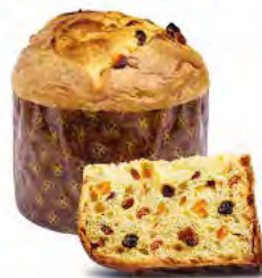
Panettone classico 1000 g