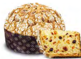
Panettone glassato 750 g