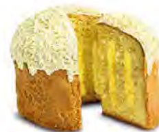
Panettone farcito al limoncello