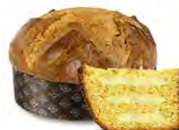
Panettone ai filari