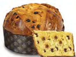
Panettone alla grappa