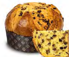
Panettone ai tre cioccolati 750 g