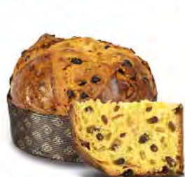
Panettone il Fondatore classico 1000 g