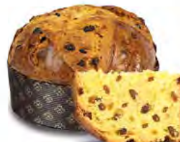
Panettone senza canditi 750 g