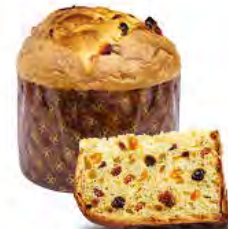
Panettone classico biologico 500 g