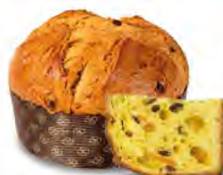
Panettone Speziato Brulé