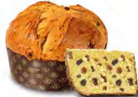
Panettone fichi e uvetta 750 g