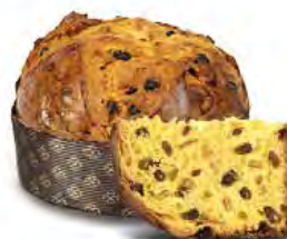
Panettone classico 750 g / 1000 g