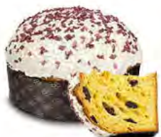
Panettone fragoline e cioccolato bianco