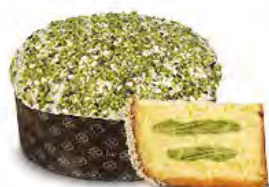
Panettone farcito al pistacchio