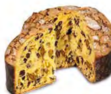
Panettone albicocche e caramello salato 750 g