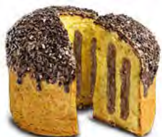
Panettone farcito al tiramisù