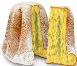
Pandoro al pistacchio 1000 g