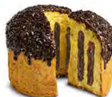
Panettone farcito al cioccolato