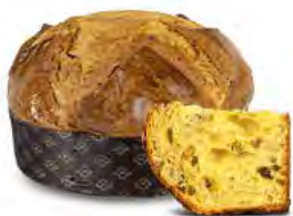
Panettone miele e noci 750 g