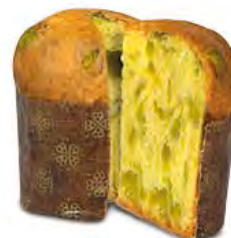
Panettoncino Mignon pistacchio 100 g