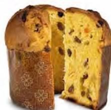
Panettoncino Mignon classico 100 g