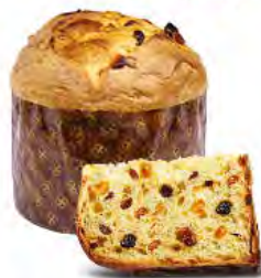
Panettone classico 750 g - 500 g