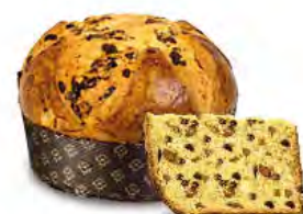
Panettone pere e cioccolato 750 g