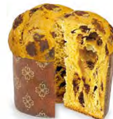
Panettoncino Mignon cioccolato 100 g