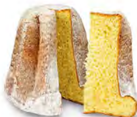
Pandoro classico 900 g